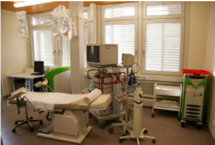
Etwa 40 Räume auf einer Fläche von 425 Quadratmetern bieten großzügigen Platz für Beratung, Untersuchung, Behandlung und Nachsorge.